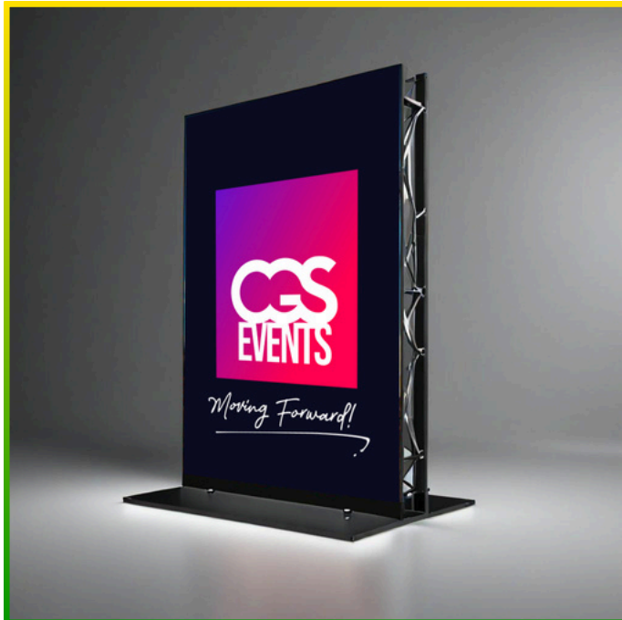
Exemplo de stand 3x2m / 6m 2 / 65ft 2 (inclui tela LED 2x2)