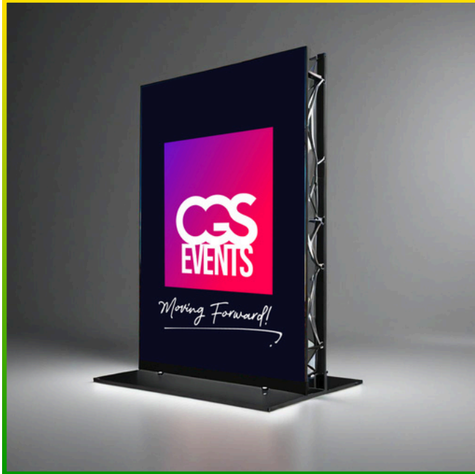
Ejemplo de stand 3x2m / 6m 2 / 65ft 2 (incluye pantalla LED 2x2m)